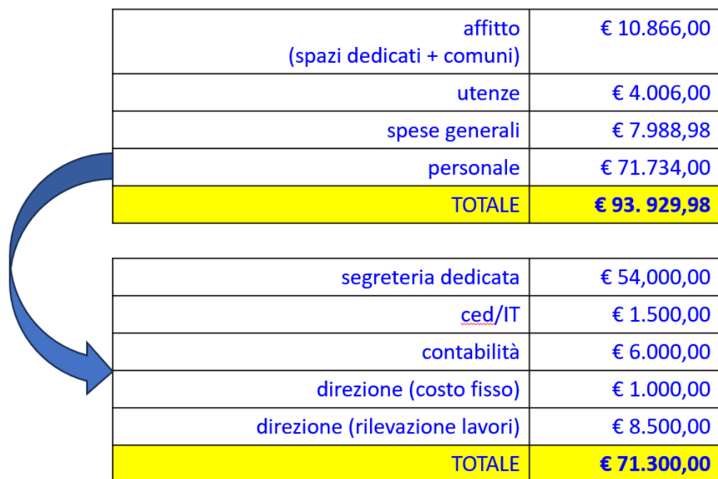
Figura 3 - Dettaglio costi del personale AP S.r.l.

Il dettaglio delle spese a noi imputate dalla AP è il seguente.